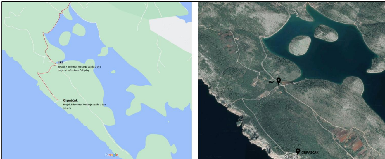
Slika 1: Prikaz lokacije Jaz i Grpašćak na karti

Na kartografskom prikazu u nastavku detaljan je prikaz lokacije centra, prometnice koja vodi do lokacije centra i lokacija uređaja koji su predmet ove jednostavne nabave.